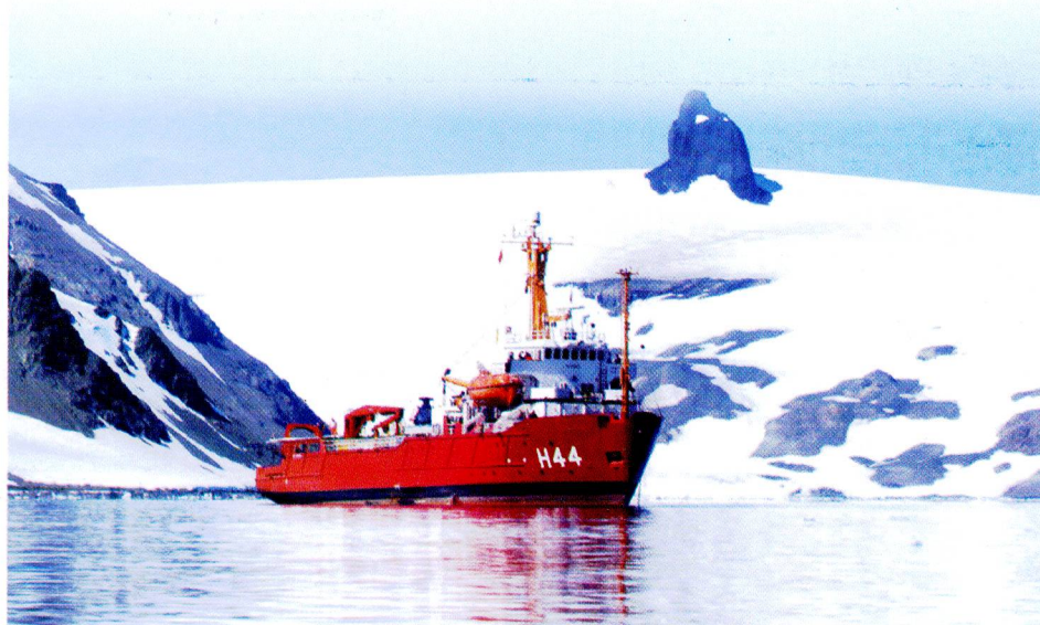
Navio de Apoio Oceanográfico Ary Rongel

Por isso, todos aqueles que participam da CIRM, Ministérios, Instituições, Colaboradores e Agentes podemos nos orgulhar do trabalho realizado. O que nos coloca a responsabilidade de zelarmos pelo futuro do País. O esforço deve continuar. Somos nós que devemos velar pelo futuro dessa Comissão.