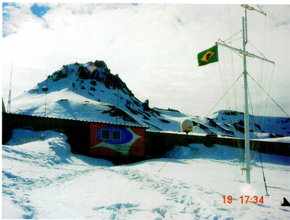
Estação Antártica Comandante Ferraz

Brasileira (Programa REPLAC), que efetuará o levantamento geológico-geofísico sistemático da PC, até o ano de 2010, detalhando os sítios de interesse geo-econômicos e avaliando os depósitos minerais existentes, o que permitirá o exercício do direito de soberania na exploração das riquezas da Amazônia Azul.