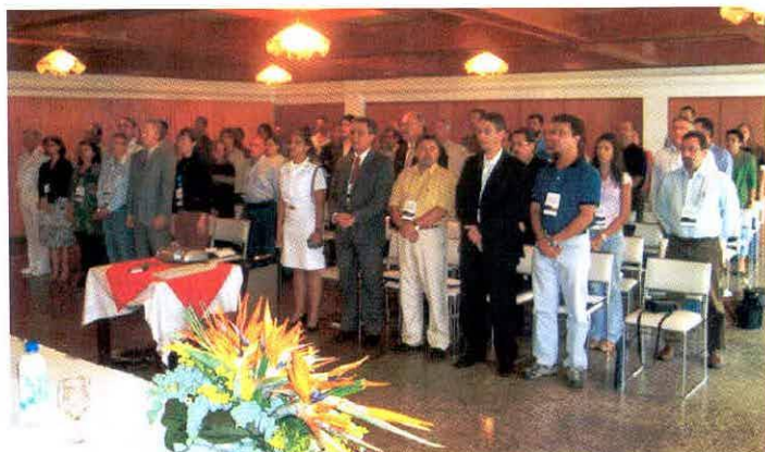
Cerimônia de abertura

Com patrocínio do Ministério da Educação (MEC), da Coordenação de Aperfeiçoamento de Pessoal de Nível Superior (CAPES) e da Secretaria da Comissão Interministerial para os Recursos do Mar (SECIRM), foi realizada a oficina de trabalho, intitulada “Formação de Recursos Humanos em Ciências do Mar”, em Florianópolis, no período de 23 a 27 de outubro de 2006.