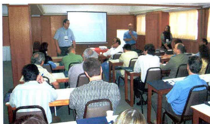
Sessão de Coordenação

O evento contou com a presença de órgãos governamentais, da comunidade científica/acadêmica e do setor produtivo, que muito contribuíram para a elaboração da Proposta Nacional de Trabalho (PNT), que norteará as ações do PPG-Mar nos próximos anos.