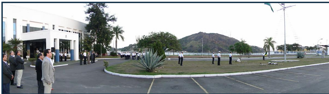
Capitania dos Portos do Espírito Santo foi o local escolhido para a realização da cerimônia

Na ocasião, foi enfatizada a importância da atuação dos agentes marítimos ao contribuírem para a consolidação do Poder Marítimo nacional e o desenvolvimento econômico do país, respeitando normas consolidadas que incrementam a segurança da navegação, a salvaguarda da vida humana no mar e a prevenção da poluição hídrica.