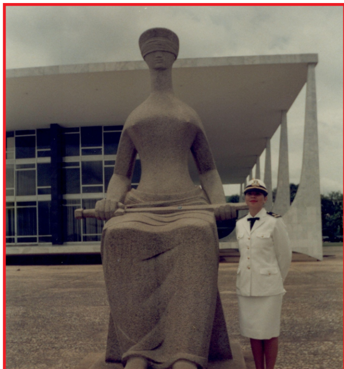
Representação em evento na Praça dos Três Poderes, quando servia na Consultoria Jurídica da Marinha (1992)