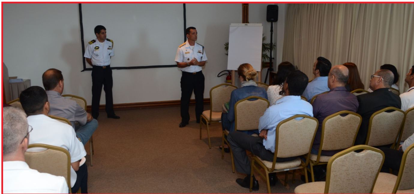
Contra-Almirante Cozzolino fez a abertura da palestra para as lideranças de organizações

A apresentação, a dois meses do início dos Jogos Olímpicos, mostrou alguns materiais que podem ser considerados suspeitos, como, por exemplo, um material abandonado ou escondido em lugares incomuns, a presença de vazamento de gás, vapor ou odor, pó aderido ao material abandonado, manchas oleosas ou com vazamento de líquidos.