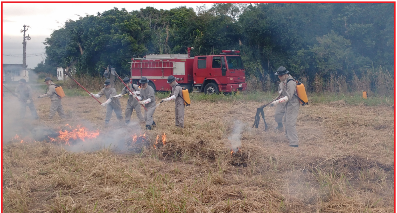
Grupo de CAV Florestal atuando no foco do incêndio.