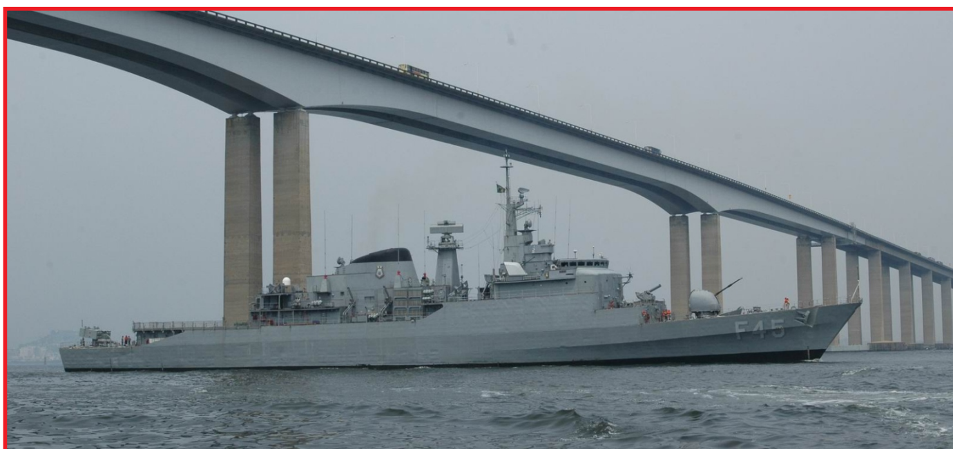
Fragata União será um dos meios utilizados pela Marinha nos Jogos Olímpicos

A Marinha do Brasil irá contribuir para a segurança das estruturas estratégicas, e poderá atuar, em caso de necessidade, como Força de Contingência e apoio à Defesa Civil. Para essas atribuições, utilizará o Grupamento Operativo de Fuzileiros Navais, que empregará 2 carros lagarta anfíbio (CLAnf) e 9 veículos blindados. Além disso, existe a participação do Centro de Coordenação Tático Integrado (CCTI) que conduzirá ações de enfrentamento ao terrorismo.