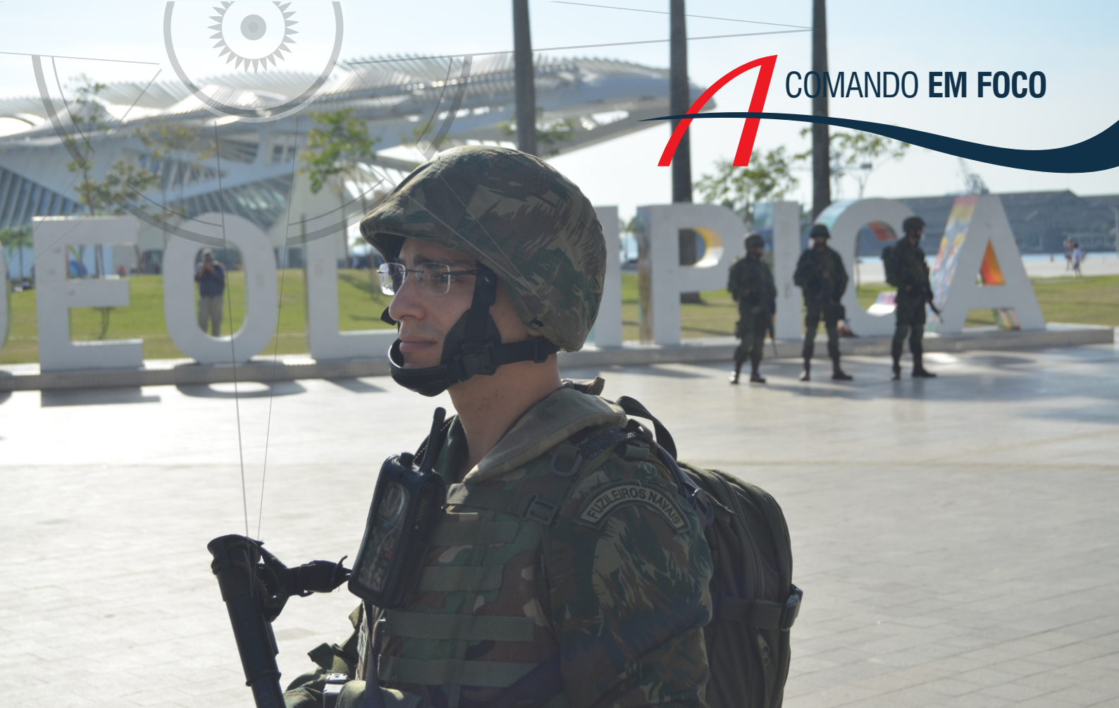
Militares da Marinha do Brasil que integram o Grupo-Tarefa Terrestre na segurança dos Jogos Rio 2016