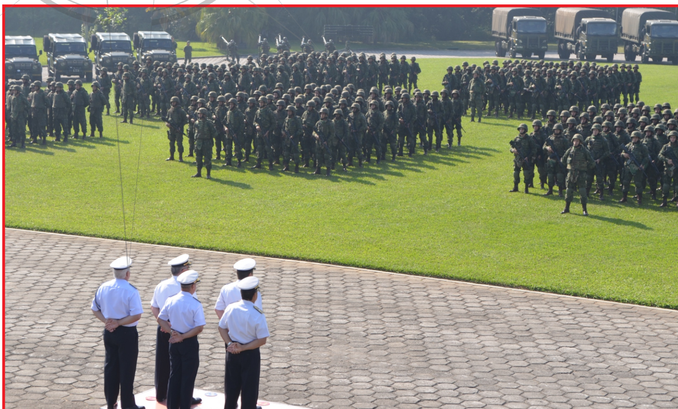
Passagem de comando dos militares que irão atuar como Força de Contingência nos Jogos Olímpicos e que integram o Comando da Força de Fuzileiros da Esquadra (ComFFE)