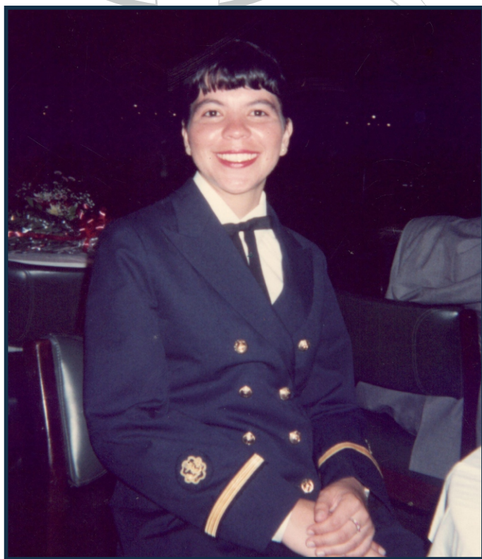
Baile de Formatura da Turma do QAFO 1992