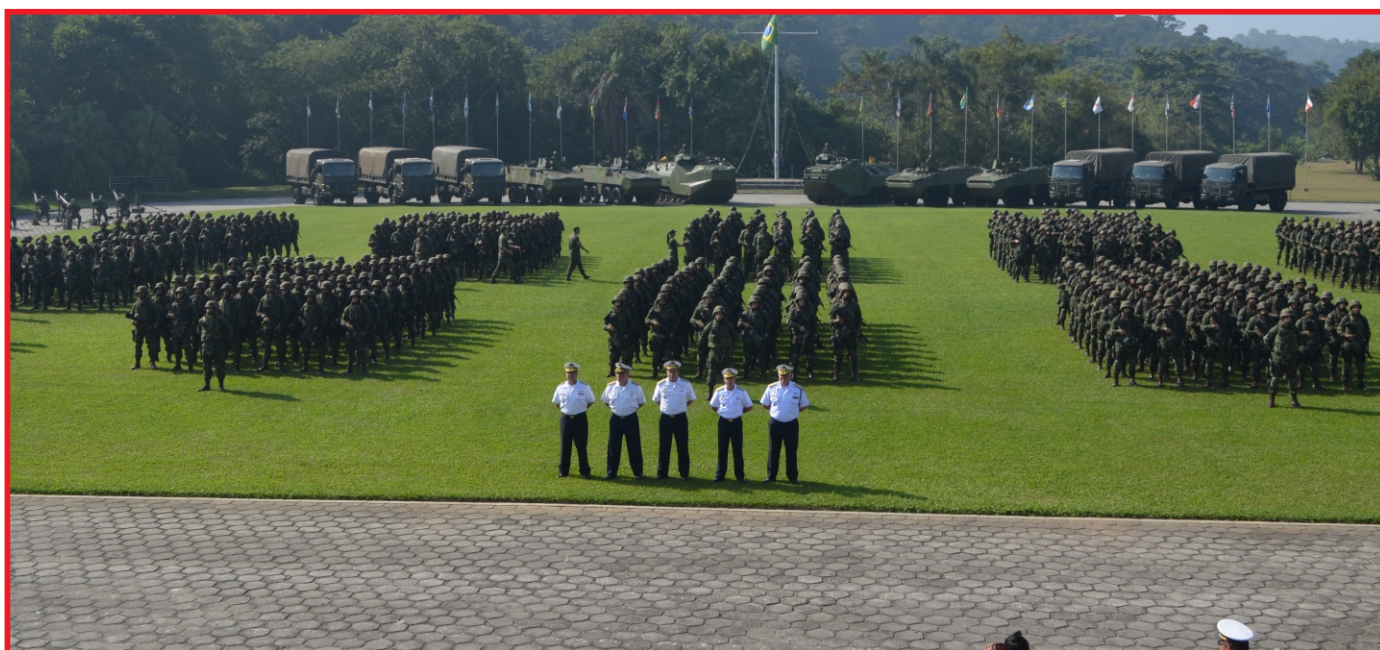
Na cerimônia, foram exibidos os meios operativos (ao fundo) que serão utilizados, como 170 viaturas operativas, 11 viaturas blindadas Piranha e dois Carros Lagarta Anfíbio (CIAnf)