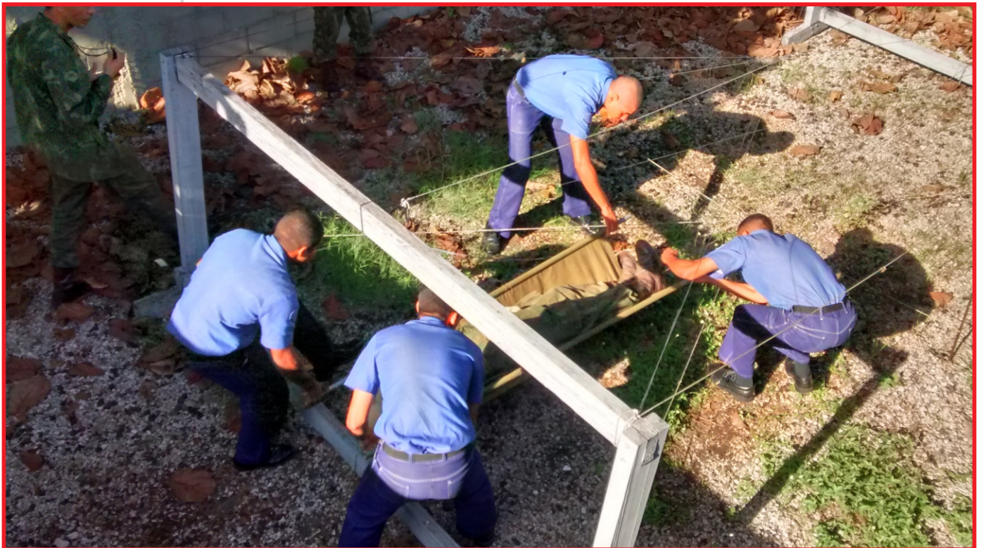
Militares solucionando os desafios de uma estações da Pista de Liderança

Durante o adestramento, os militares estiveram sob a constante supervisão de instrutores do CIASC, mostrando-se motivados diante dos desafios que lhes eram apresentados.