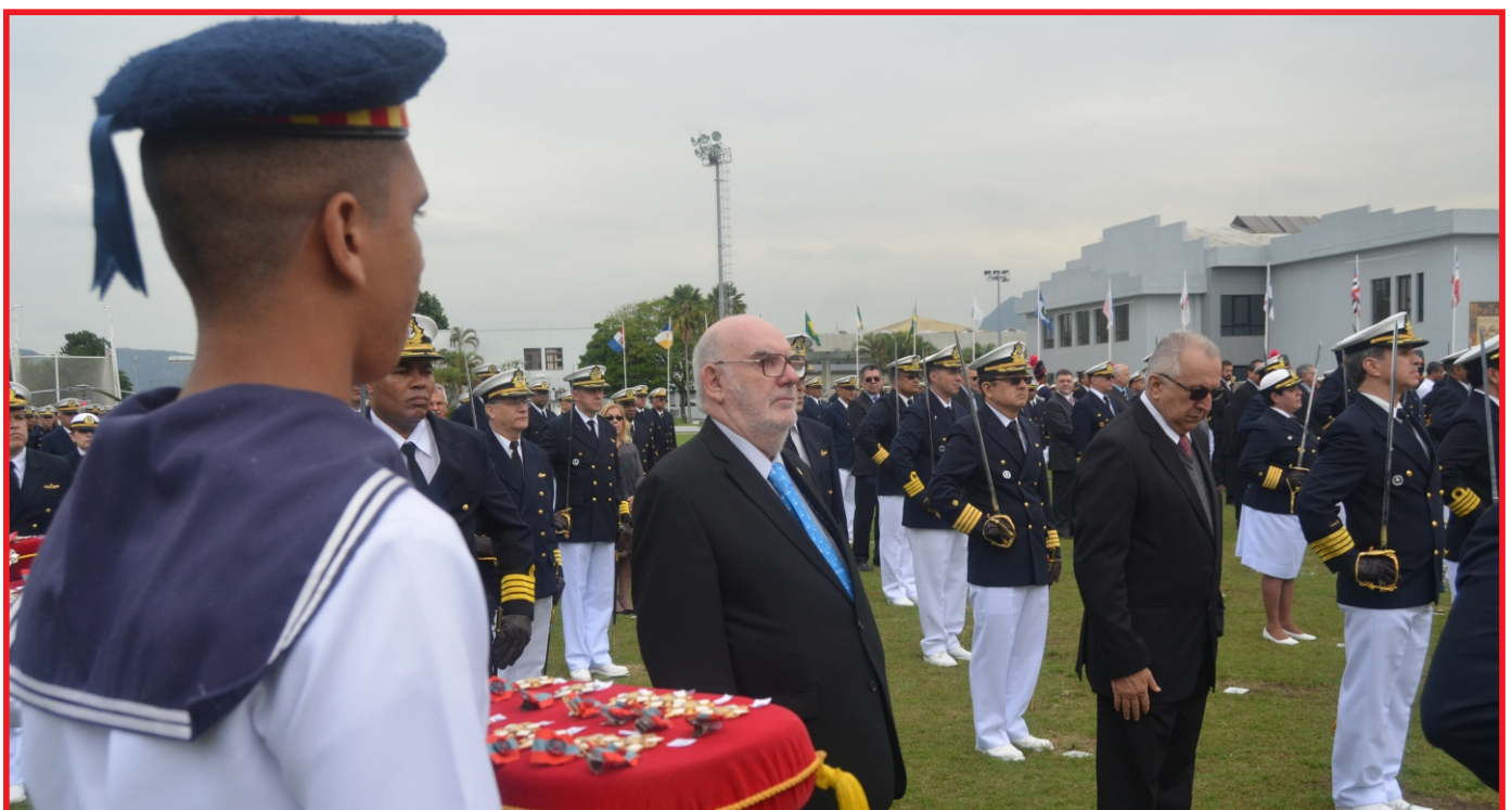
Imposição da medalha aos 244 agraciados