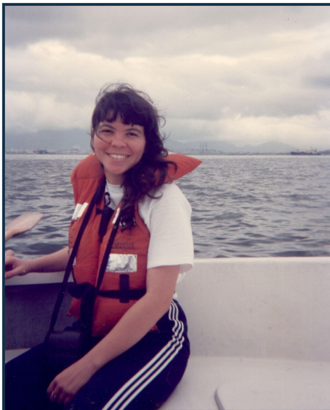
Aula de Remo, no Curso de Formação de Oficiais de 1992, no CIAW