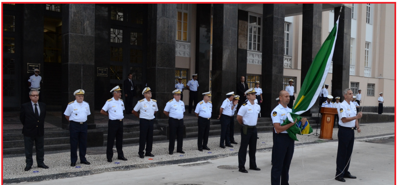
Comandante da Marinha preside cerimonial à Bandeira