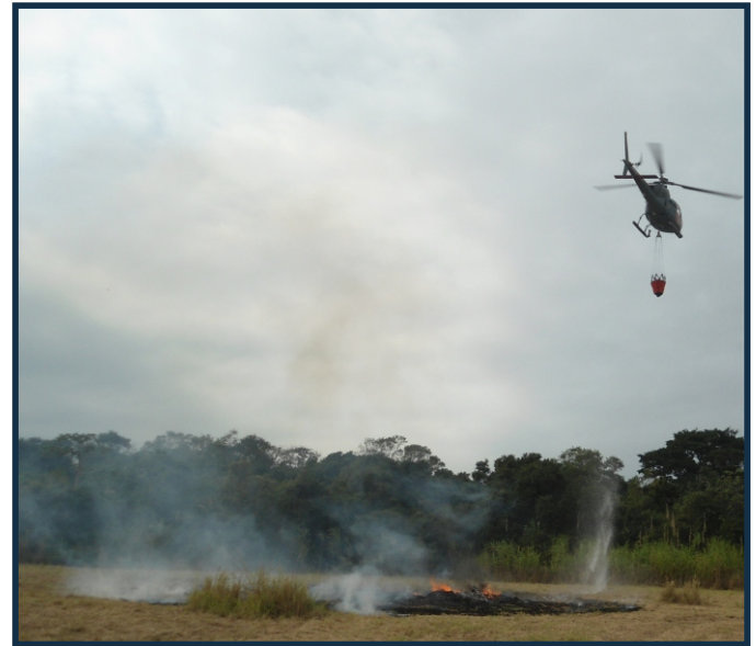
Aeronave com o dispositivo Bambi Bucket na área do exercício de Incêndio Florestal

A ERMCN fica sediada na cidade de Cabo Frio (RJ) e é responsável por uma área de aproximadamente 860 Hectares.