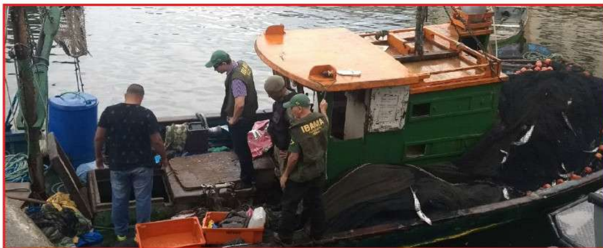
Marinha, IBAMA e 7ª UPAM participaram da ação conjunta para reprimir a pesca ilegal