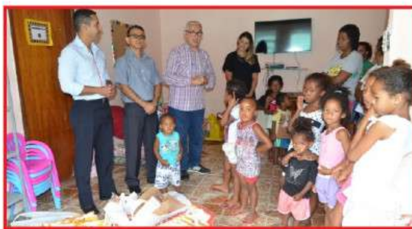
Crianças da Casa Semente aguardam ansiosas a entrega de presentes pelos militares do Com1ºDN