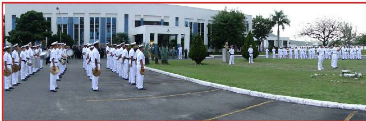
Cerimônia alusiva ao Dia Marítimo Mundial na CPES