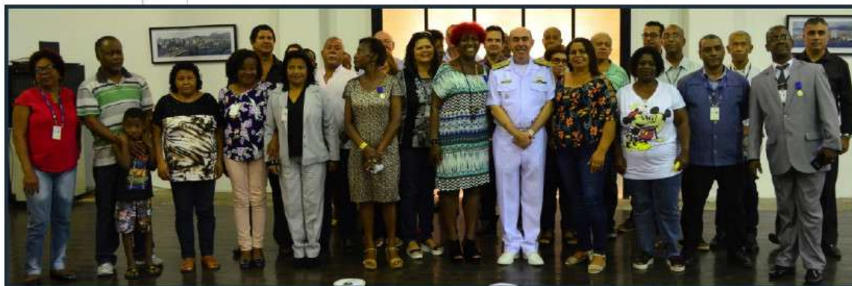
Cerimônia do Dia do Servidor Público é marcada por homenagens aos Servidores Cíveis