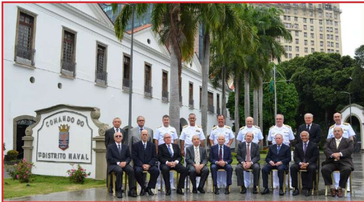
Ex-comandantes do 1º Distrito Naval na foto anual de aniversário do DN