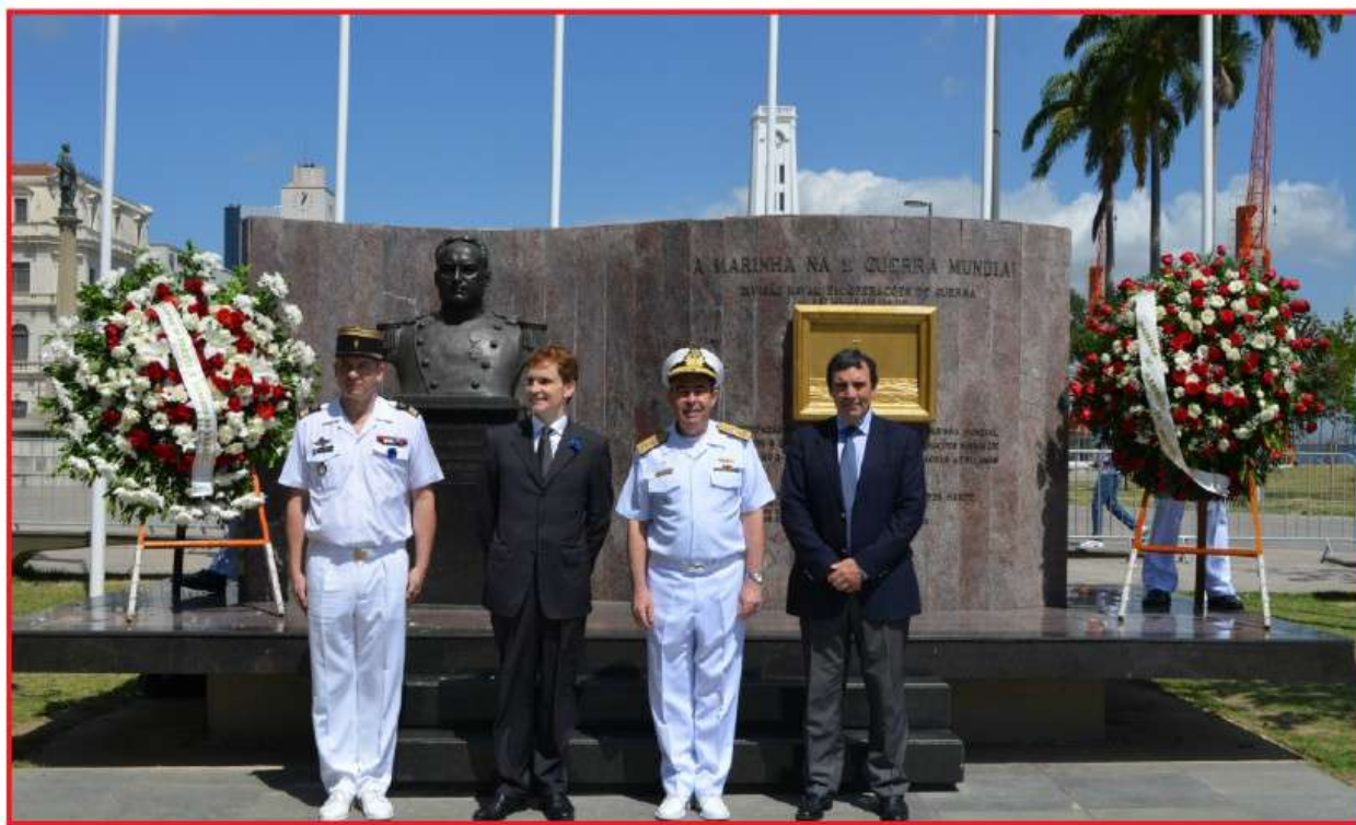
O Com 1º DN e o Cônsul Geral da França no Rio de Janeiro fazem aposição floral junto ao busto do Almirante Pedro Max de Frontin

A solenidade foi iniciada com a execução do Hino Nacional, seguida de leitura da Ordem do Dia e aposição floral junto ao Busto do Almirante Pedro Max de Frontin, feita pelo Comando do 1º Distrito Naval e pelo Cônsul Geral da França no Rio de Janeiro.