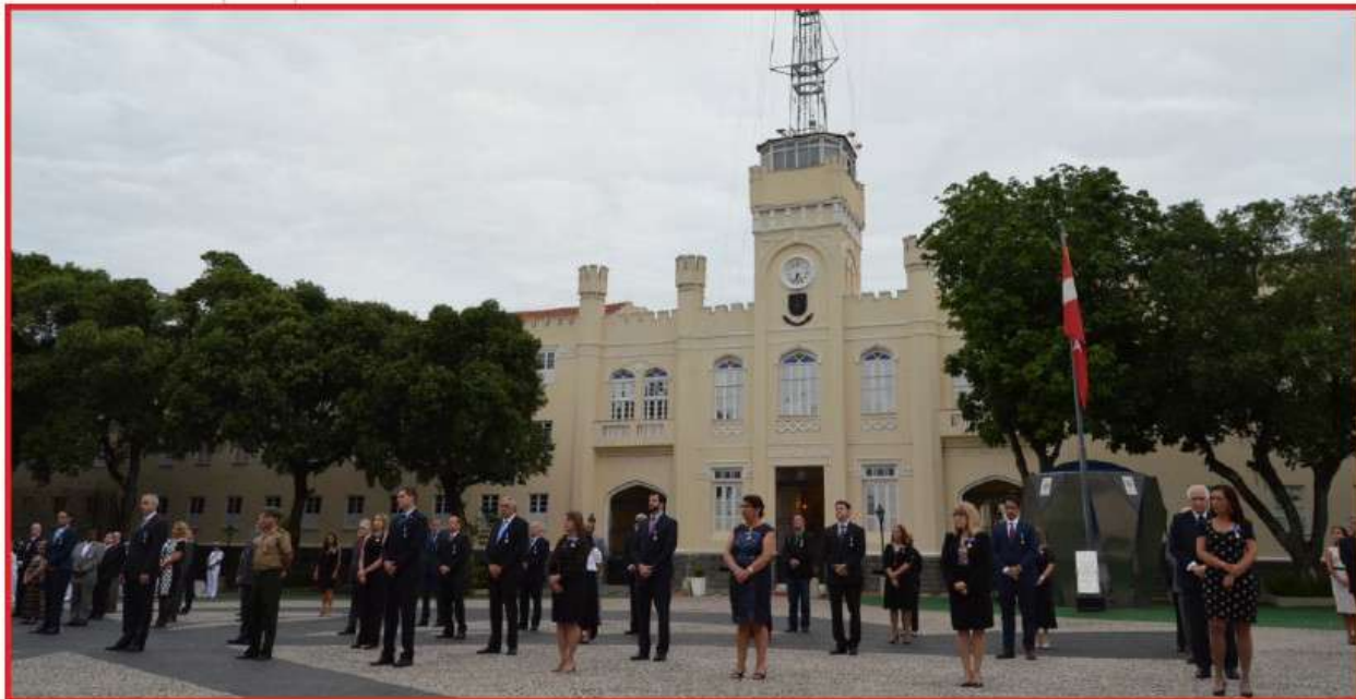
Marinha do Brasil celebra o dia do Amigo da Marinha

O Comando do 1º Distrito Naval realizou, no dia 6 de novembro, a Cerimônia comemorativa ao Dia Nacional do Amigo da Marinha, na Fortaleza de São José. A solenidade, alusiva aos 38 anos da Sociedade Amigos da Marinha (SOAMAR- Brasil), agraciou 110 representantes da sociedade civil e militares com a medalha Amigo da Marinha, personalidades que contribuíram para difundir a importância da MB para o desenvolvimento do País, e em ampliar a consciência marítima e da Amazônia Azul.