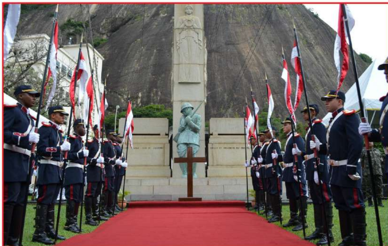
Cerimônia faz homenagem às vítimas da Intentona Comunista

A solenidade tem o objetivo de manter vivo o permanente compromisso das Forças Armadas com a defesa da Pátria e dos ideais democráticos da Nação Brasileira. Em memória às vítimas que deram suas vidas em prol dos ideais democráticos em 1935, foram realizados a aposição de uma coroa de flores junto ao mausoléu, o toque de silêncio e uma salva de gala executada pela bateria de obuses. Como tradição, foi realizada a chamada nominal das vítimas que tombaram naquela ocasião.