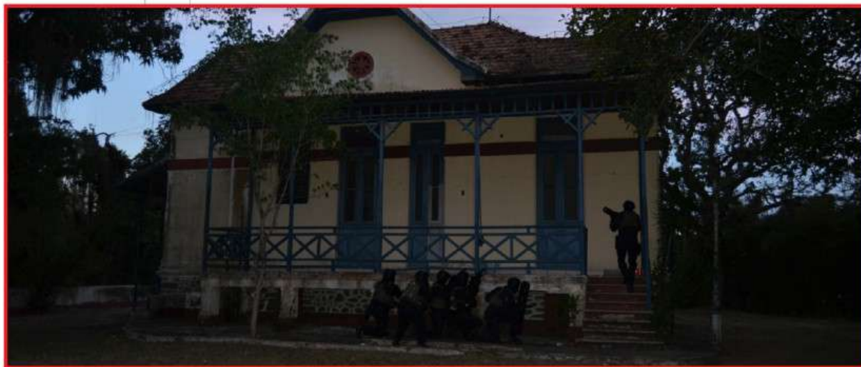
Militares praticam a ação de choque com o emprego da força em treinamento

O Comando do 1º Distrito Naval (Com1ºDN) realizou a Operação de Exercício de Retomada e Resgate (RETREX), dia 9 de novembro, na Estação Rádio da Marinha no Rio de Janeiro (ERMRJ). O exercício simulou uma operação de defesa junto a uma tentativa de invasão à Organização Militar (OM), sediada na Ilha do Governador (RJ), acompanhada de ações criminosas como o sequestro de militares.