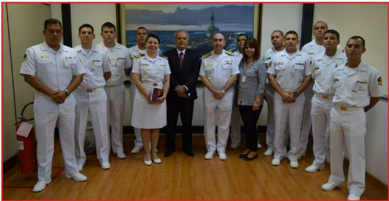
Militares do Com1ºDN se mostram entusiasmados com a Aula Inaugural