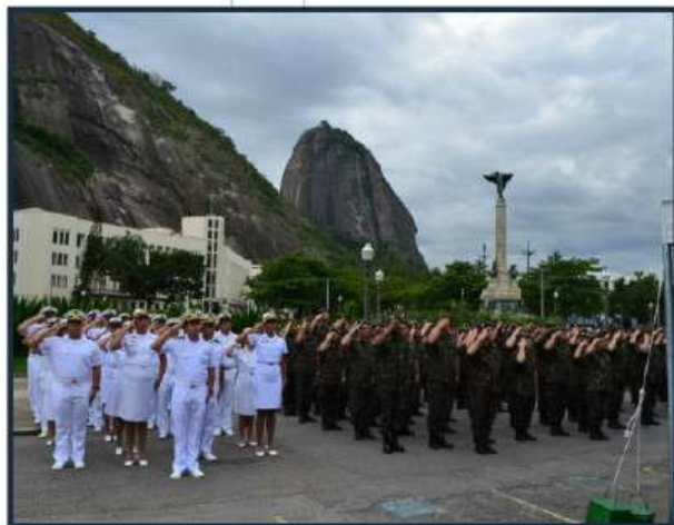
Militares do Com 1ºDN participam da cerimônia com as demais Forças

Os militares do Comando do 1º Distrito Naval (Com1ºDN) representaram a Marinha do Brasil (MB) na Cerimônia anual em homenagem às vítimas da Intentona Comunista de 1935, realizada no dia 27 de novembro pelo Comando Militar do Leste (CML), na Praia Vermelha, Urca (RJ).