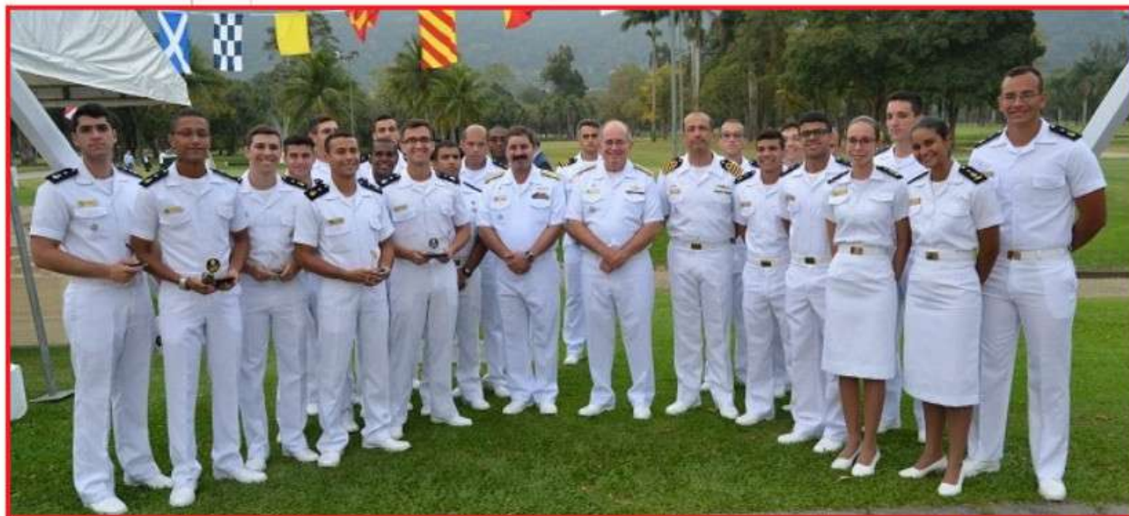
Equipe do Grêmio de Golfe da Escola Naval