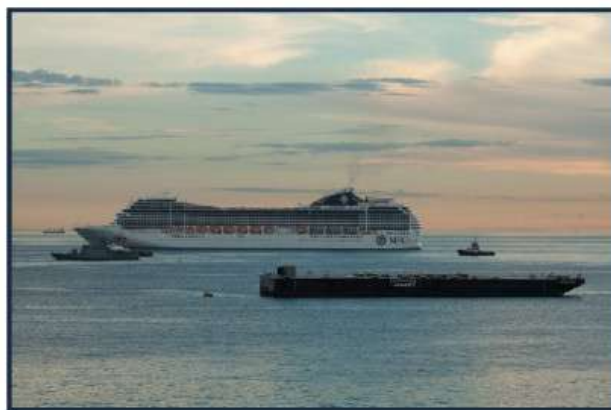
Navio-Patrolha "Gurupi" apoiando a segurança do evento