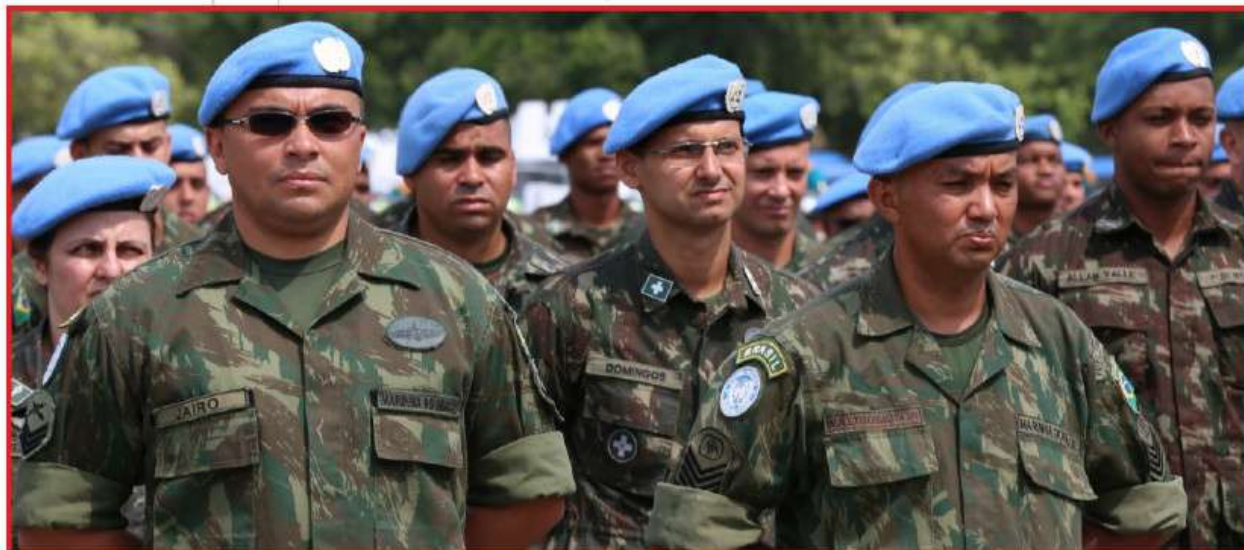
Militares das três Forças Armadas foram homenageados pelo Ministério da Defesa

O Comando do 1º Distrito Naval (Com1ºDN) participou da Cerimônia de Término da Participação Brasileira na Missão das Nações Unidas para estabilização do Haiti (MINUSTAH), no Monumento Nacional aos Mortos da 2ª Guerra Mundial, no dia 21 de outubro, no Aterro do Flamengo (RJ). A solenidade foi presidida pelo Ministro da Defesa Raul Jungmann.