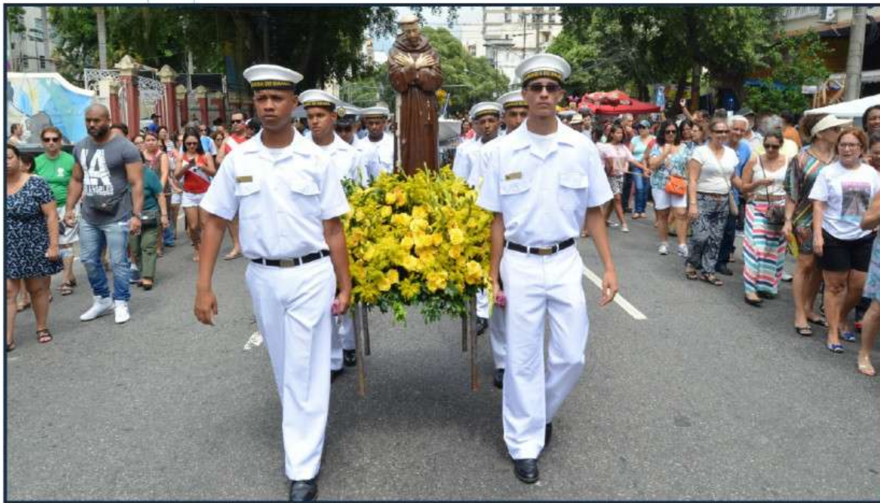
Marinheiros levam a imagem de São Francisco de Assis durante a procissão do Círio de Nazaré

O s militares do Comando do 1º Distrito Naval (Com1ºDN) representaram a Marinha do Brasil (MB) na procissão do Círio de Nazaré, tradicionalmente celebrada na Igreja de São Sebastião dos Capuchinhos, Tijuca (RJ). Durante a cerimônia, marinheiros se revezaram para levar as imagens de São Francisco de Assis e de Nossa Senhora de Nazaré pelas ruas do bairro, acompanhados de perto pelos fiéis.