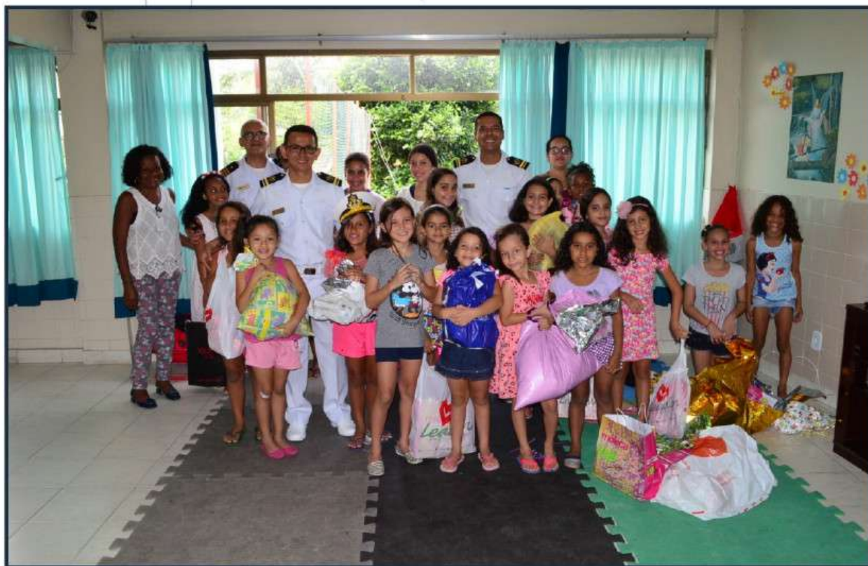
Crianças do Lar de São José recebem presentes doados por militares do Com1ºDN

O Comando do 1º Distrito Naval (Com1ºDN) realizou, nos dias 11 e 12 de dezembro, a Campanha de Solidariedade Natalina com a doação de brinquedos a crianças do Lar de São José, em Laranjeiras (RJ) e da Casa Semente, em Jardim Gramacho (Duque de Caxias).