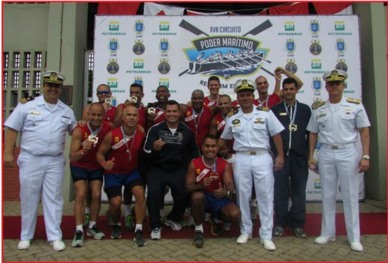
Equipe do Corpo de Fuzileiros Navais (CFN) comemora a conquista da última etapa do XVII Circuito Poder Marítimo de Remo em Escaler, realizada no CIAGA

A equipe do Corpo de Fuzileiros Navais (CFN) sagrou-se campeã, na categoria “Veterano”, da oitava e última etapa do XVII Circuito Poder Marítimo de Remo em Escaler, realizada no dia 19 de novembro, no Centro de Instrução Almirante Graça Aranha (CIAGA). O Grupamento de Fuzileiros Navais do Rio de Janeiro (GptFNRJ) contribuiu para esta conquista, com a presença de nove militares entre os 11 que compõem a equipe.