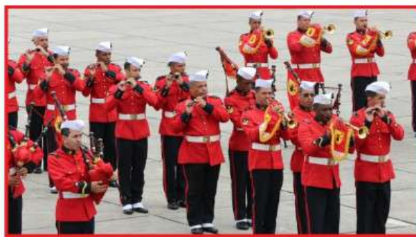
Apresentação da Banda Marcial do Corpo de Fuzileiros Navais em homenagem aos ex-combatentes

A cerimônia, que homenageou os mais de 37 mil militares participantes das operações naquele País, entre fevereiro de 2004 e outubro de 2017, contou com o desfile da tropa de Fuzileiros Navais. Na sequência, foi executado o toque de silêncio e uma salva fúnebre de 15 tiros pelo Navio-Patrolha “Gurupi”. Logo depois, houve a entrega dos diplomas aos ex-Comandantes do componente militar da missão, aos ex-Comandantes da brigada de força e paz e aos ex-Comandantes de tropa. Por fim, ocorreu a apresentação da Banda Marcial do Corpo de Fuzileiros Navais.