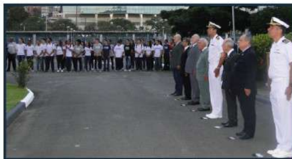
Alunos do curso Técnico em Portos do IFES participaram da cerimônia

O Dia Marítimo Mundial foi criado em 1978, durante a Convenção da Organização Marítima Consultiva Intergovernamental (IMCO), entidade que deu origem à atual Organização Marítima Internacional (IMO). Desde então, a data passou a ser comemorada em todo o mundo, especialmente para destacar a importância das indústrias marítimas no comércio internacional.