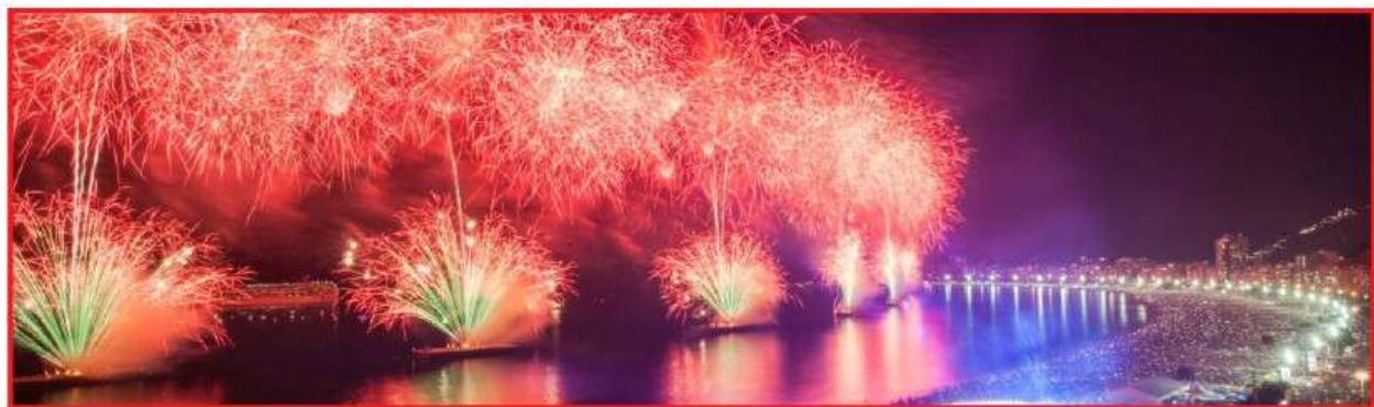
Queima de fogos do Réveillon 2018 em Copacabana