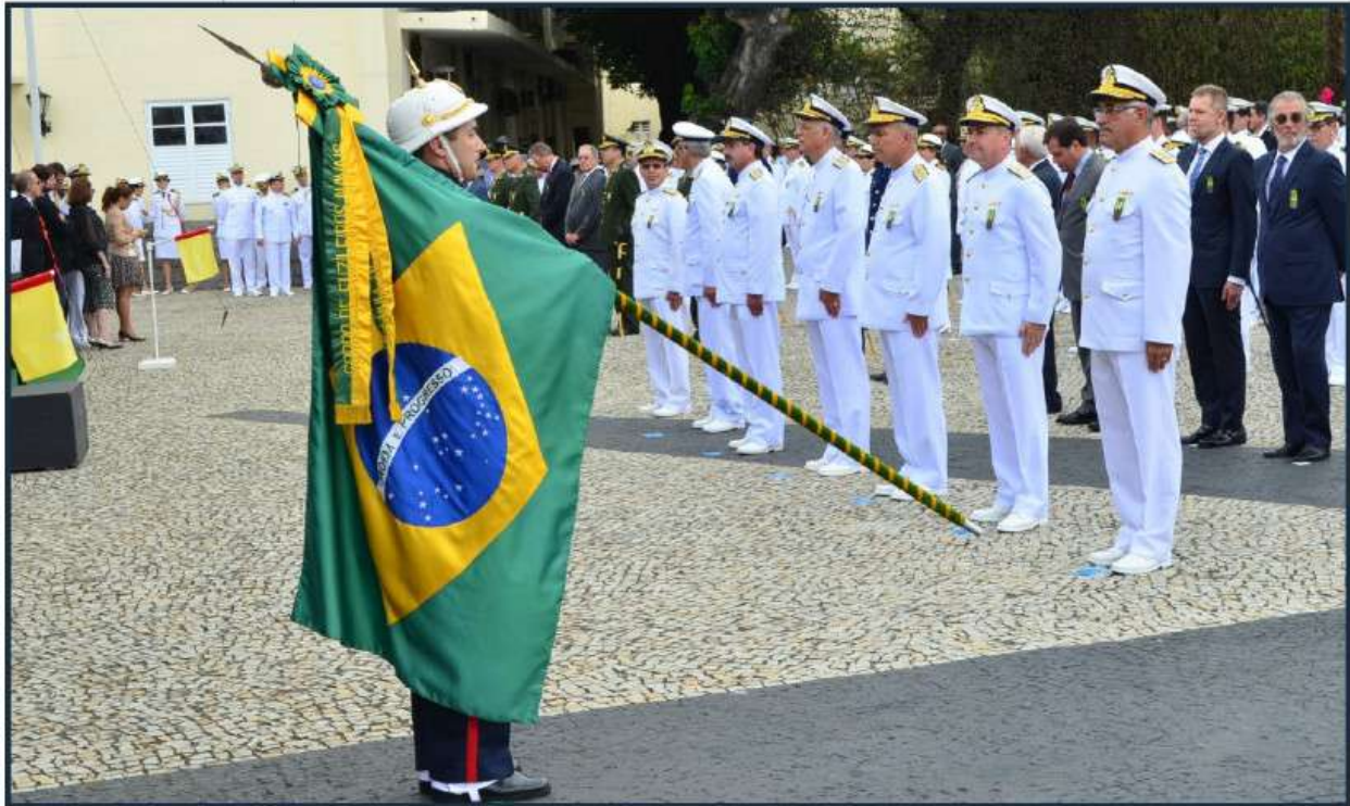
Cerimônia celebra o nascimento do Almirante Joaquim Marques Lisboa, o Marquês de Tamandaré

O Comando do 1º Distrito Naval (Com1ºDN) realizou, no dia 13 de dezembro, a Cerimônia alusiva ao Dia do Marinheiro e Imposição da Medalha “Mérito Tamandaré”, na Fortaleza de São José (RJ), sede do Comando-Geral do Corpo de Fuzileiros Navais. O Dia do Marinheiro é, tradicionalmente, celebrado nesse dia, em referência à data de nascimento do patrono da Marinha do Brasil (MB), o Almirante Joaquim Marques Lisboa, o Marquês de Tamandaré.