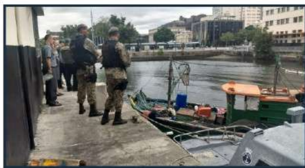
Após a constatação das infrações, a embarcação foi apreendida

As equipes do IBAMA e da 7ª UPAM observaram a existência de 820 quilos de pescado na embarcação, cuja licença de pesca encontrava-se vencida. Dessa forma, a carga também foi apreendida pelo IBAMA, sendo destinada a instituições de caridade credenciadas. A CPRJ vem realizando a fiscalização do tráfego aquaviário, em conjunto com o IBAMA, a fim de coibir irregularidades à Lei de Segurança do Tráfego Aquaviário, bem como de reprimir a pesca ilegal no interior da Baía de Guanabara.