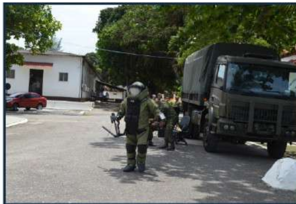
Militar em ação durante o Exercício Retrex na Estação Rádio

A Operação RETREX é uma oportunidade para testar a agilidade de reação assim como a atualização de adestramento obtido para ação em situações extremas.