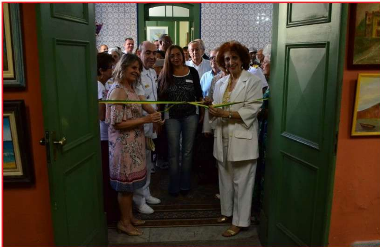
O Comandante do 1º DN e a presidente da SBBA na inauguração do XXXVI Salão Marinha do Brasil

O XXXVI Salão Marinha do Brasil ficou aberto ao público de 6 a 13 de dezembro expondo, em seus quadros, criações que retratam o mar e as atividades navais.