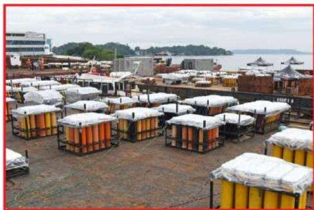
Inspeção final das balsas de fogos de artifício