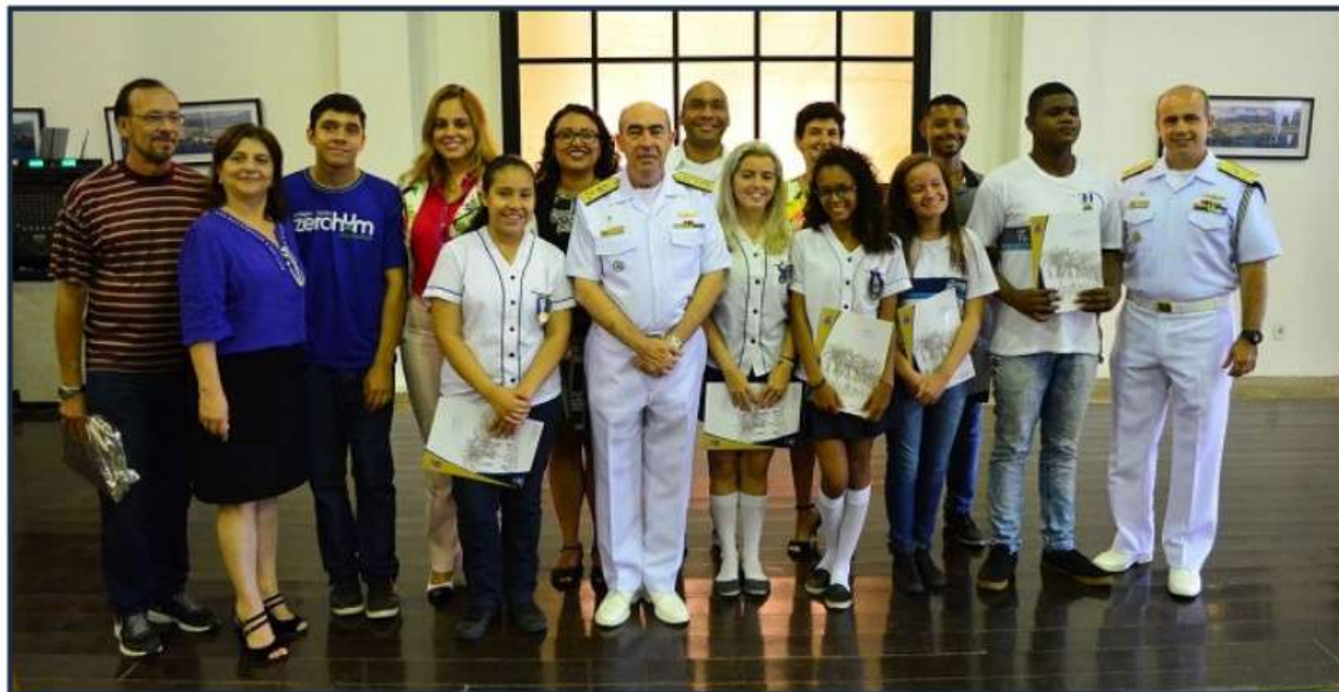
Vencedores da Operação Cisne Branco recebem os prêmios no Salão Histórico do Com1ºDN

A Operação “Cisne Branco” é uma atividade de Relações Públicas conduzida pela Marinha do Brasil, desde 1976, com o propósito de despertar nos jovens, seus pais e professores o interesse pelos assuntos relacionados ao Poder Naval, Poder Marítimo, Amazônia Azul e História Naval do Brasil, contribuindo para o desenvolvimento de uma mentalidade marítima na população brasileira.